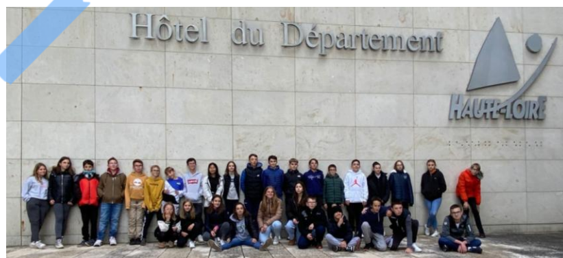
Visite de l'hôtel du Département