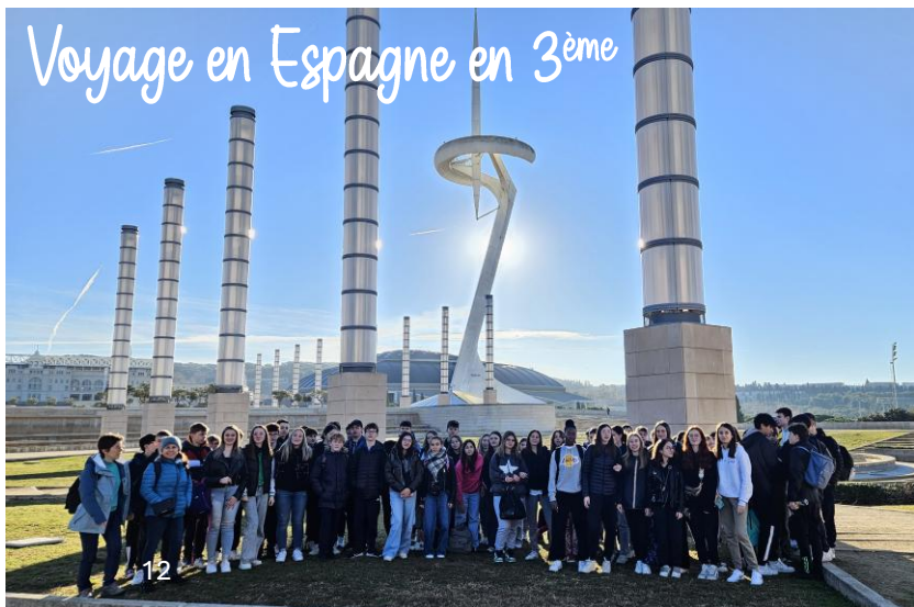
Voyage en Espagne en 3 ème