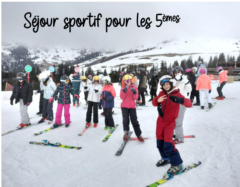
Séjour sportif pour les 5 èmes