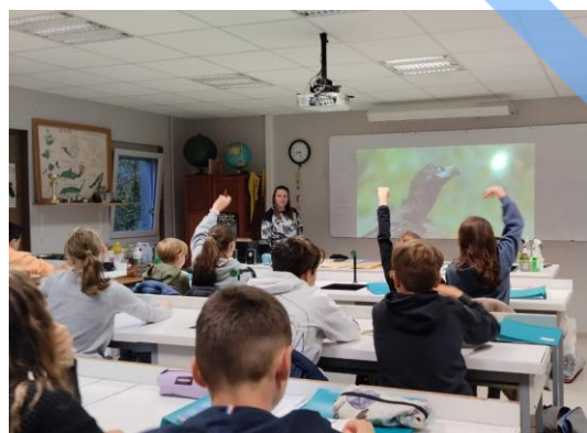
Intervention de la LPO