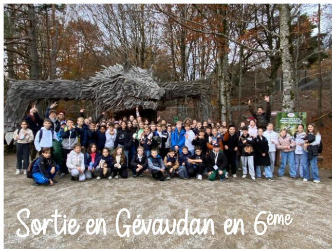
Sortie en Gévaudan en 6 ème