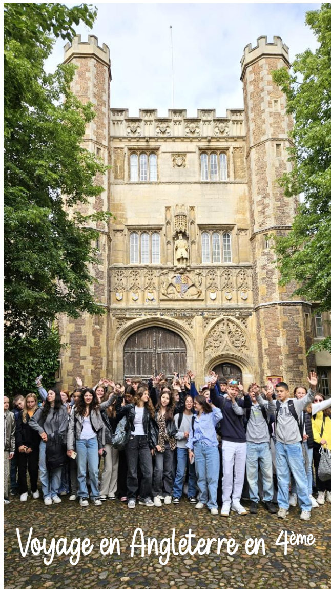
Les voyages scolaires en images...