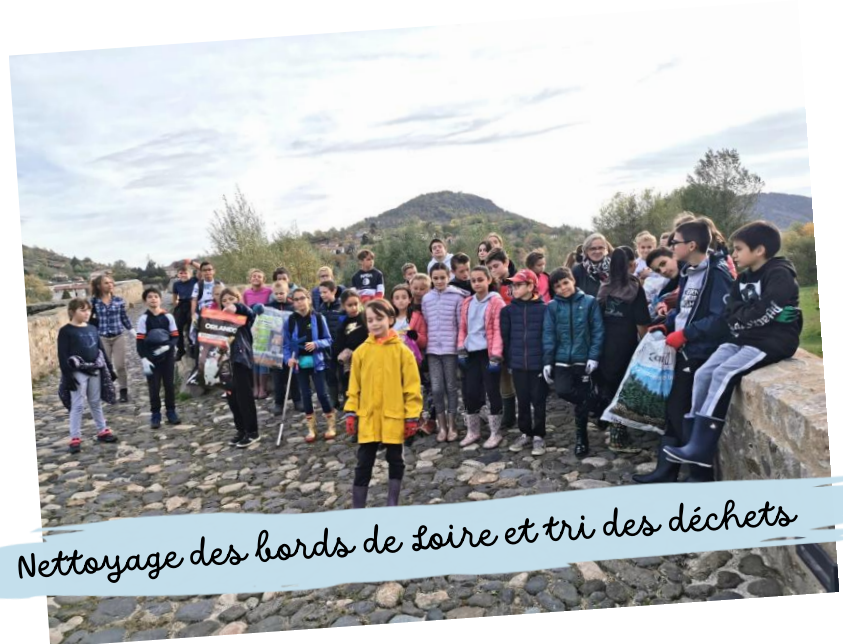
Nettoyage des bords de Loire et tri des déchets

Tout au long de l'année, le collège organise et participe à des actions de solidarité et de citoyenneté pour développer chez les élèves des valeurs altruistes. Ils vont à la rencontre d'associations pour mieux comprendre l'esprit de solidarité qui anime les bénévoles.