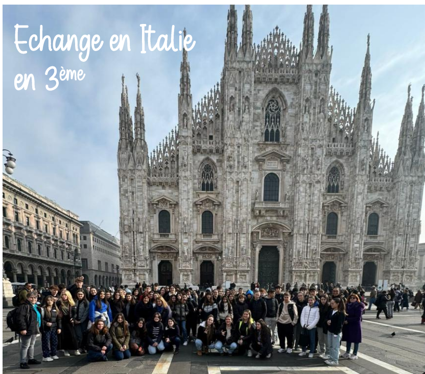
Echange en Italie en 3 ème