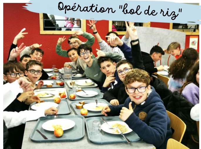
Opération "bol de riz"